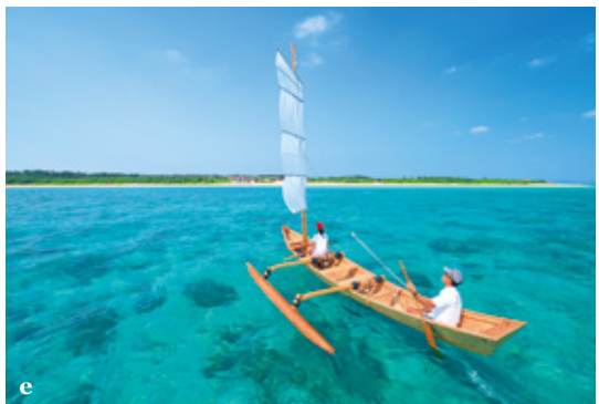
caption a 海底まで見渡せることができる澄んだ青い海。スノーケルツ アーにて存分に楽しめます。 b 綺麗なサンゴ礁を眺めながら海 ガメと一緒に八重山の海をご堪能ください。 c 八重山近海で見 ることができる最大で8mにも達する巨大エイ「マンタ」。写真は マンタスクランブルポイント。 d 干潮時にしか姿を現さない石 垣島と小浜島の間にある浜島（幻の島） e ビーチから白い帆に風 を受けて海へと漕ぎ出す帆掛けサバニ船。沖縄の伝統的な木造船 で八重山の海を楽しみます。

日本最大のサンゴ礁に抱かれ た小浜島 八重山諸島は国内最大のサンゴ礁と 世界有数の透明度を誇る感動の海。 400種類を超える造礁サンゴが分 布し、国内外から学術的にも高い評価 を得ている貴重な海域です。 小浜島は八重山諸島の中心に位置し、 多様なスノーケルやダイビングポイ ントに囲まれた南海の楽園です。