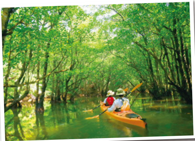
心落ち着く大自然に抱かれながら、ここでしか味わうことのできない自分だけの楽しみを。