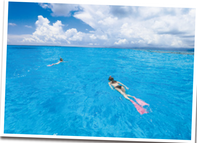
見る者を魅了する、どこまでも青く澄んだ海。