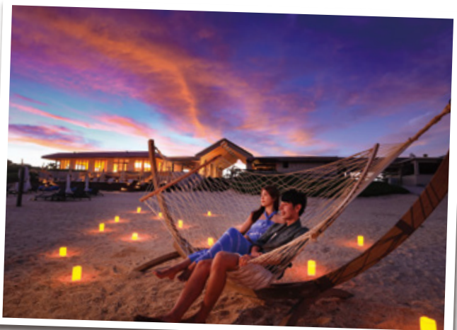
八重山の風を感じながら、「島時間」に癒されるぬちぐすいリゾート。