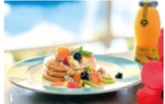
caption a サンゴ礁の海と八重山の島々を眺めながら、お食事を楽しめる海空テラス。 b 開放的なテラスでは朝食もいただけます。 c 八重山の星空の下、開放的な空間でバーベキューを楽しむグリルダイニングのテラス席。 d 大人の隠れ家のような、クラシカルで優雅な雰囲気クラブダイニング。 e お肉や野菜を選べるスープで味わうスープしゃぶしゃぶ。 f デトックス効果を高め、免疫力を上げるとも言われている発酵食。 g オープンカフェ&バーでは、オリジナルのカクテルで南国気分。 h 海空テラスで星空に癒されるリゾートナイト。 i 自家製ヨーグルトとフレッシュフルーツで食べる黒糖パンケーキ。

開放的なテラスで 至福のひとときを 夜は星が輝く空の下、 オープンカフェ&バーのテ ラスやライトアップされた プールサイドで島酒やオリ ジナルカクテルに舌鼓した ながら、ゆるりとお寛ぎた だけます。